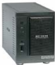
Tamaño pequeño y conveniente para usar en casa (~6x4x9in)

•Ofrece un almacenamiento extra que puede ser aprovechado por todos los ordenadores de la red.